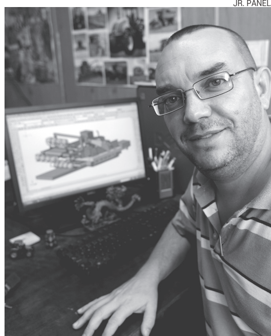
Projeto do Prof. Albiero deverá estar no mercado em até três anos

A colhedora é definida como se fossem “três robôs montados num trator”. O primeiro segura a planta com a pressão necessária; o segundo corta com cuidado para não estragar o produto; e o terceiro apanha a planta cortada e a encaminha para embalagem. A colhedora é movida a diesel e mede 5 m x 3 m.