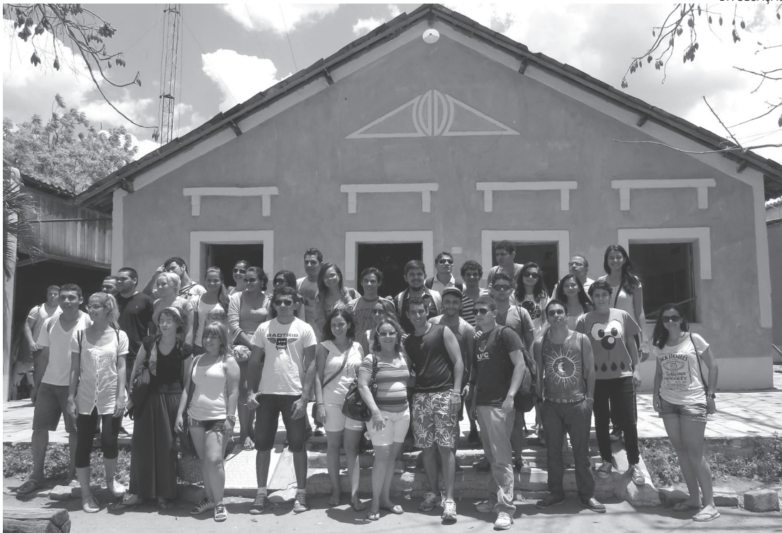
Os primeiros 24 participantes do Projeto visitaram o Cariri. Do grupo, 85% não conheciam a região

Além de viajarem para várias regiões do Estado, os participantes trocam conhecimentos sobre as ações extensionistas da UFC