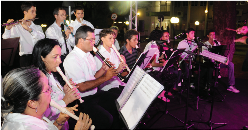
Orquestra de flautas e outras atividades culturais são ofertadas pela Progep

Outro objetivo é otimizar a lotação do pessoal a partir de um estudo de demandas