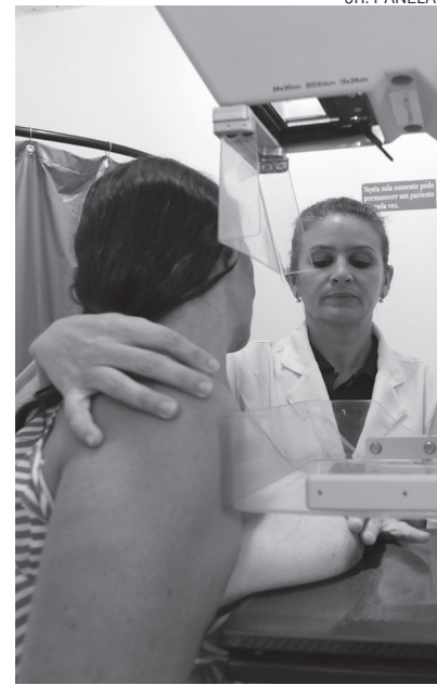
Cerca de 3,5 mil mulheres já fizeram mamografia gratuita

O câncer de mama foi tema internacionalmente debatido durante o chamado Outubro Rosa, no qual foram realizadas diversas ações de conscientização da prevenção e do diagnóstico precoce da doença. Na UFC, o Projeto Iracema, desenvolvido desde 2007, é uma das principais ações na área, buscando identificar nas mulheres do bairro Rodolfo Teófilo, em Fortaleza, os maiores fatores de risco de incidência do câncer de mama através de exames clínicos e de imagem. Trata-se de uma das atividades do Grupo de Educação e Estudos Oncológicos (Geeon), vinculado ao Departamento de Cirurgia da Faculdade de Medicina da UFC.