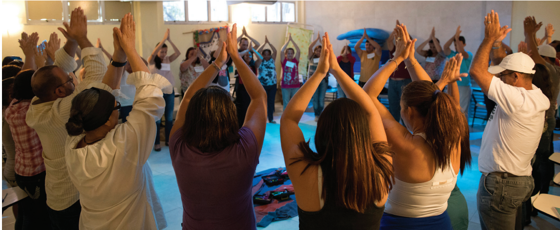
Público aproveita espaços da UFC para cuidar do corpo e da mente, com alongamento e yoga

No meio do corre-corre de aulas, estágio e trabalho, que tal uma soneca após o almoço ou uma parada para meditação? Ou, quem sabe, uma sessão de acupuntura? Na UFC, iniciativas voltadas para o bem-estar e o controle do estresse já beneficiam alunos, professores, servidores técnico-administrativos e também pessoas da comunidade externa.