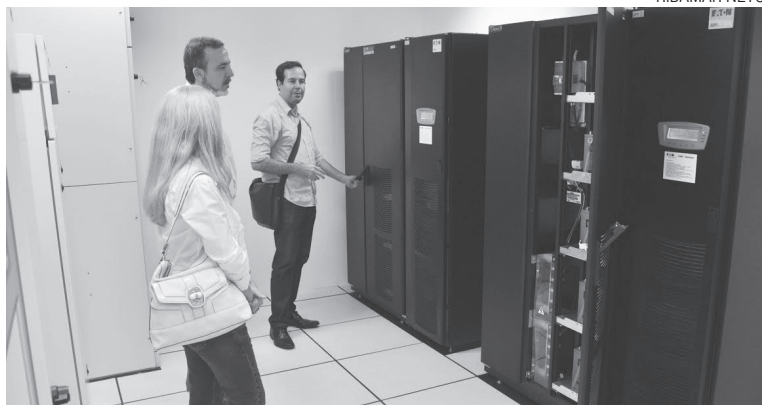
A sala-cofre, que abriga o data-center, é uma das ações do PDTI

Uma demanda histórica da UFC tornou-se finalmente realidade. Foi aprovado – e já está em execução – o Plano Diretor de Tecnologia da Informação (PDTI) da Universidade. Um dos objetivos do plano é estabelecer uma rede de Internet sem fio em toda a UFC, com acesso de qualidade. Atualmente, o acesso à rede Wi-Fi pode ser feito apenas em algumas áreas dos campi do Pici e do Benfica.