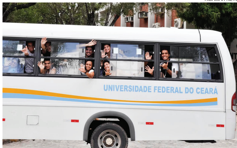
Estudantes da UFC retornam para aulas no dia 10 de fevereiro