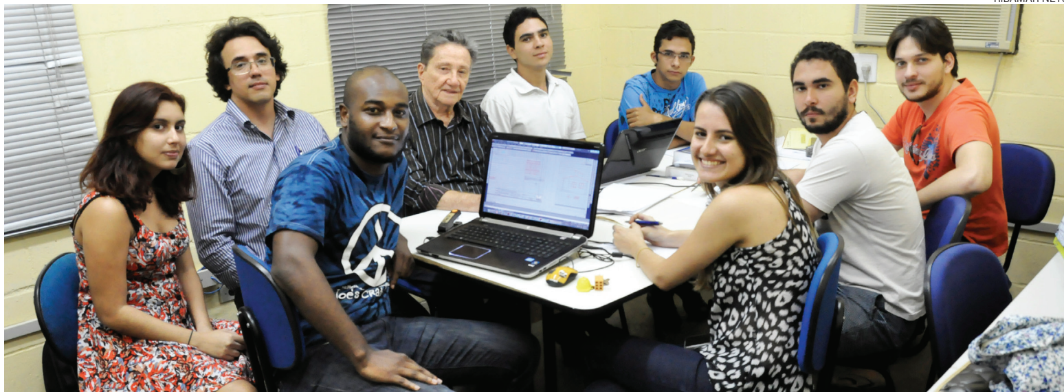
Turma do Etecs auxilia processos de regularização fundiária para pessoas pobres

Em uma tarde de segunda-feira, um grupo de sete estudantes da UFC avaliava, com um professor, o projeto de reforma de um prédio da Base Aérea em Fortaleza. Sobre a mesa, livros, rascunhos e o computador em que analisavam a simulação da obra. O grupo precisava decidir se a estrutura do telhado seria refeita com madeira, concreto ou aço, já que as paredes antigas exigem cuidado.