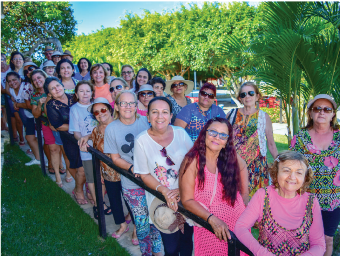
Turma de servidoras aposentadas da UFC participantes do projeto, que existe desde 1993

Depois de anos e anos de trabalho na UFC, voltar à Universidade para um novo compromisso. Desta vez, com o lazer e a qualidade de vida. Todas as quartas-feiras, das 14h às 17h, um grupo de cerca de 25 senhoras e senhores se reúne na Universidade para participar das atividades do Projeto de Valorização do Aposentado, da Pró-Reitoria de Gestão de Pessoas (Progep). Palestras, oficinas, cursos e atividades físicas são realizados, gratuitamente, com esse público, cuja disposição não diminuiu com o passar dos anos.